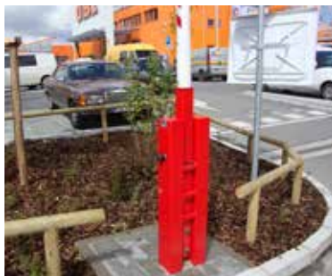
Solidt bomhus med integreret aflåsning.