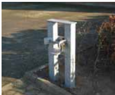
Låses med rigle/bolthængelås