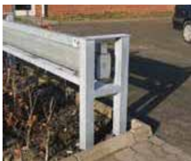
Specialbukket, stærkt hulprofil

KIBO skydebom SKB 10 sikrer på en god og markant måde et område imod uønsket kørende trafik. Skydebommen er robust og udviser stor styrke.