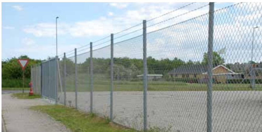
Fletvævshegn fra KIBO Sikring anvendes typisk til at markere og afgrænse et bestemt område, fx institutioner eller industrianlæg. Afhængig af risikoprofil kan pigtråd tilvælges.

Fletvævshegn fra KIBO Sikring anvendes til at sikre et afgrænset område og giver en pæn og vedvarende markering af territorium. Hegnet er designet på en sådan måde, at det falder naturligt ind i terrænet og giver en stabil og imødekommende afgrænsning.