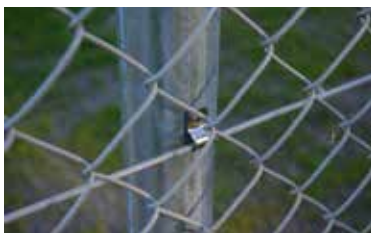
Strammetråde er monteret i vandrette linier med lige stor afstand indbyrdes. Strammetråden er monteret til stolpe via rustfri trædbøjle og blindnitte.