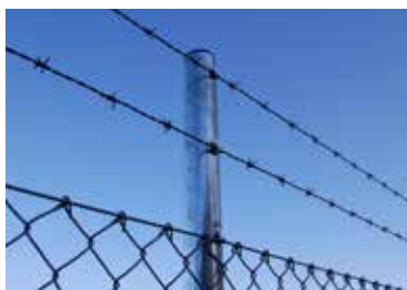
Fletvævshegnet kan leveres med to rækker pigtråde over fletvæven.