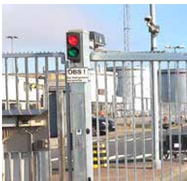
Sikkerheden omkring hurtigfoldeporten er en selvfølge. Standarden har som minimum fotoceller og sikkerhedslistere.

KIBOs hurtigfoldeport HFP 10 sørger for en sikker og hurtig passage for køretøjer. Porten udmærker sig ved, at køre op til 1,0 meter per sek. samt ved at være produceret af meget driftsikre komponenter.