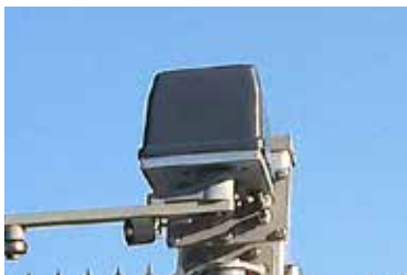
Solid og driftssikker DAAB motorspil