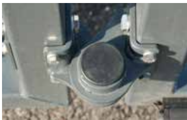
Kraftige hængsler sikrer driftssikker funktion af porten