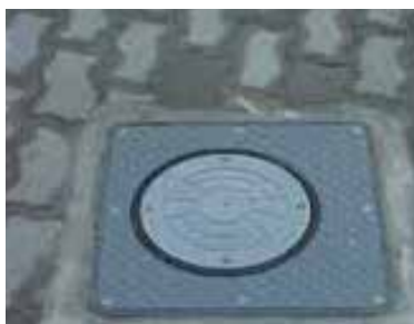
Nedsænket i terræn