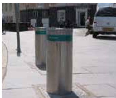
Solid og robust pullert

KIBO pullerten PUE 40 findes i tre versioner: Fast, semi-automatisk og automatisk med indbygget hydraulisk motor.