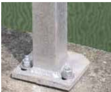
Fodplade boltet fast

KIBO rækværket SRV 10 skaber en naturlig afgrænsning og er samtidig med til at sikre en naturlig adgang til områder, der ellers kunne være utilgængelige.