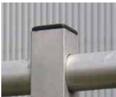
Sort plasthætte og gennemgående håndliste