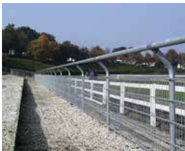
Rækværk med gitterudfyldning