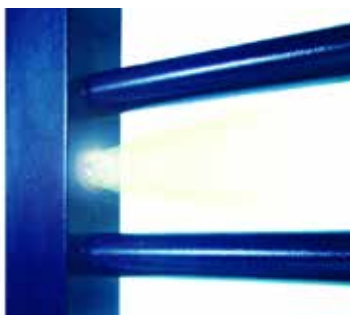
Lys i siden af ROL 2