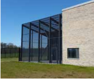
Sikringsgitre kan med fordel bruges til sikrede gårdtursarealer. Både lodret og vandret.