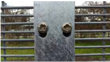
Gitre samles over stolpen og fastholdes med kraftig fladjern.

KIBO sikringshegn SKH 10 anvendes på steder med krav om ekstra høj sikring.