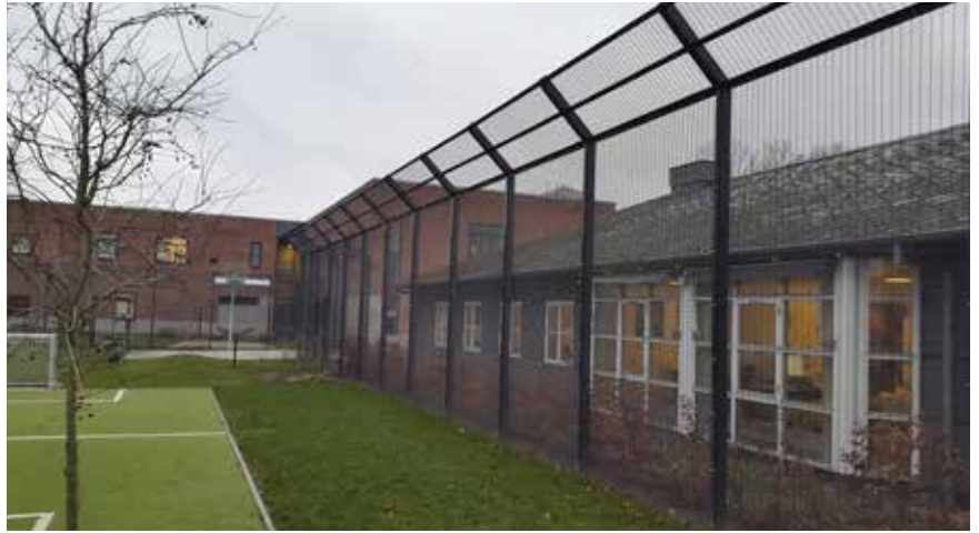
400 cm højt sikringshegn med 1 meter skråudlæg - samlet højde 470 cm over terræn.

KIBO sikringshegn SKH 10 anvendes på steder med krav om ekstra høj sikring.