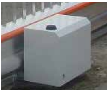
Låses med rigle/bolthængelås

KIBOs skydebom SKB 400 danner en robust og sikker afgrænsning af et område, der skal aflukkes for kørende trafik.