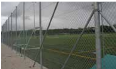
Dobbelte skråstivere i hjørnet