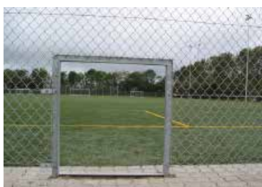
Krybeåbning i hegnet

KIBO idrætshegn IDH 10 anvendes primært i 3-6 meters højde på boldbaner, tennisbaner og som her - bag et fodboldmål.