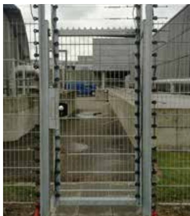
Adgangsveje sikres også med ESH10

Med KIBOs elektriske sikringshegn dannes en ekstra præventiv sikringsforanstaltning, når et eksisterende eller nyetableret basishegn skal opgraderes til et endnu højere sikringsniveau.