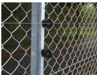
Solide profiler med kraftige isolatorer