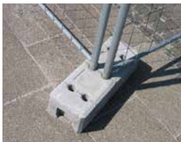
36 kg tung betonfod

Mobilhegn fra KIBO giver sikker afspærring kombineret med stor stabilitet og fleksibilitet. Det er den ideelle løsning til afskærmning af et område over både korte og længerevarende perioder.