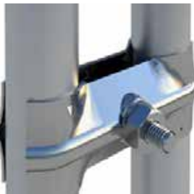
Mobilhegnene kan sikres med kraftige beslag