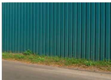
Pladeelement i moduler på 1030 mm