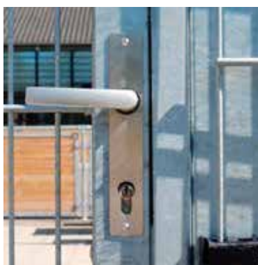
En indbygget cylinderlås giver en stærk og sikker aflåsning af ganglågen.