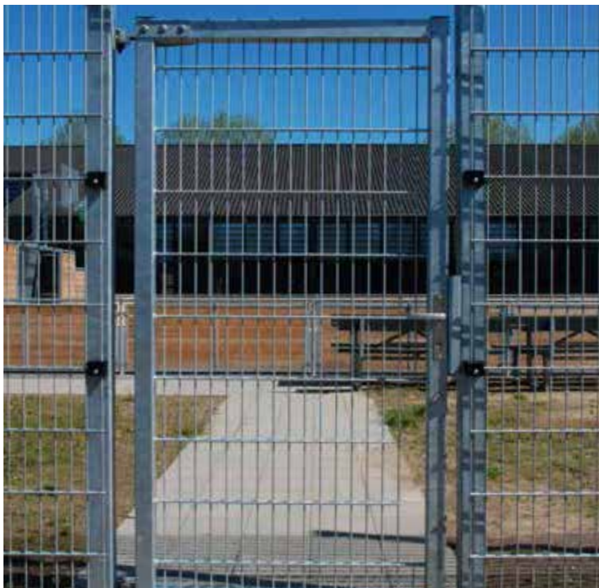
Denne ganglåge, model GLÅ 30e, fra KIBO Sikring er en klassisk ganglåge, som ofte anvendes i institutioner, på skoler og i have- og parkanlæg.