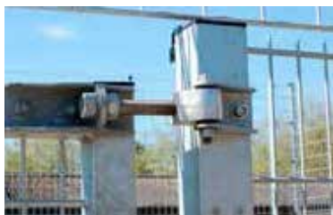
Justerbare hængsler gør ganglågen til et sikkert valg blandt de fleste kunder.