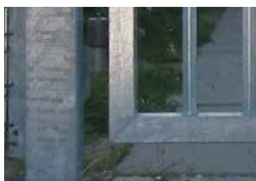
Balustre i en robust konstruktion

KIBO ganglåge GLÅ 80 er en præsentabel balusterlåge, der i størrelse formes efter ønske og behov og således passer godt ind i omgivelserne. Den giver en robust og sikker aflåsning af et område.