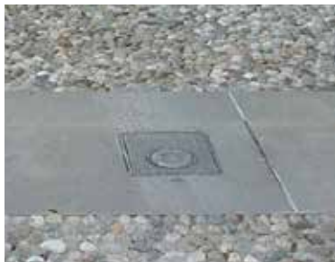
Nedsænket i terrænet