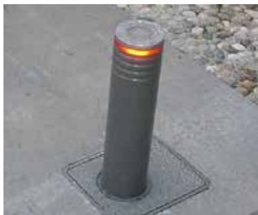
Pullert med lys

KIBO pullerten PUE 30 er disponibel i tre forskellige varianter: Fast, semi-automatisk og automatisk med indbygget hydraulisk motor.