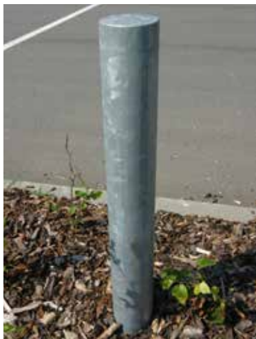
Varmforzinket pullert med glat overflade

KIBO pullerten PUF 10 er en god og fleksibel løsning, når et bestemt område skal afgrænses eller lukkes for kørende trafik, idet pullerten forhindrer adgang eller gennembrud.