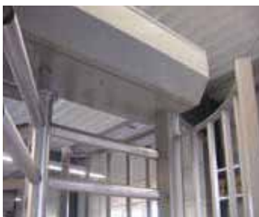
Specielt som option - vanskeliggør overklating

KIBOs rotationslåge ROL1 etablerer sammen med et professionelt hegn basis for regulering af persontrafik.